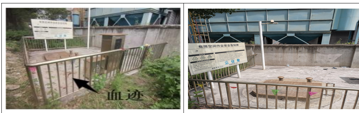
图 1 涉事泵站情况

1. 涉事泵站位于南通市崇川区陈桥街道荣盛路 398 号附近，泵站东北角有一只摄像头正对池盖，池盖北侧设置有“有限空间作业安全告知牌”，池盖南侧有两只电气控制箱，池盖与电气控制箱之间地面有一滩血迹（见图 1）。