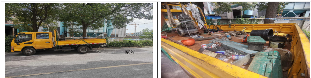
图 2 泵站西侧工程车情况

3. 泵站南北长 4.7 米，东西宽 4.45 米；泵池池体为圆柱体，内径 2 米，深 4.2 米；池盖为长方形，长 1.23 米，宽 1.03 米；距池底 1.2 米处有一操作平台，池口有一直梯与操作平台连接（见图 3）。